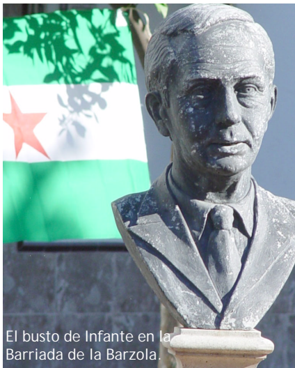
El busto de Infante en la Barriada de la Barzola.

El pasado diez de agosto se cumplió el 68º aniversario del asesinato de Blas Infante a manos del fascismo español. Para la conmemoración de dicha jornada, las organizaciones independentistas Jaleo y Nación Andaluza acordaron la realización conjunta de los actos, que vienen a romper cada año el silencio mediático e institucional alrededor de las aspiraciones para nuestro pueblo por las que luchó hasta ser fusilado Infante. Este año los actos empezaron a las 18.30 de la tarde con una abundante pegada de carteles y puesta de banderas en la glorieta de Blas Infante, en la Barriada de la Barzola, por parte de un nutrido grupo de militantes. La siguiente cita era, como viene siendo habitual, en el kilómetro 4 de la Carretera de Carmona, donde tradicionalmente la izquierda nacionalista andaluza venimos realizando el acto de homenaje y recuerdo al Padre de la Patria Andaluza. Allí nos reunimos varias decenas de militantes y simpatizantes desplegando una pancarta y dando lectura el texto que reproducimos a continuación.