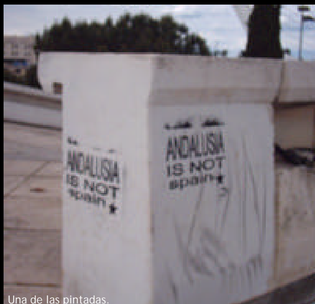
Una de las pintadas.